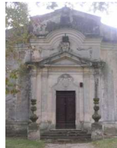
Oratorio di Belvedere